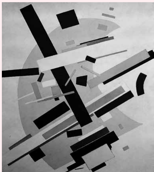
Kasimir Malevitch Suprématisme (1916)